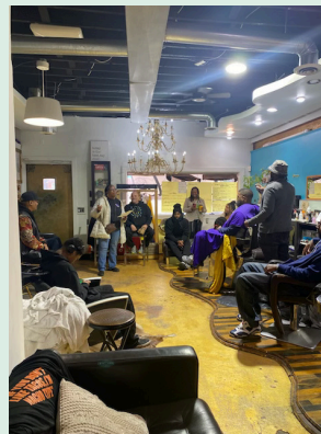
Serie de deterioro económico en Jay's Fade Barbershop